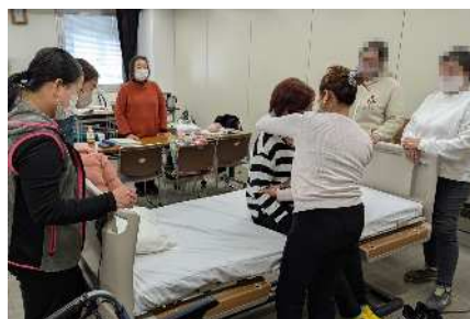
Domínio das técnicas de cuidados