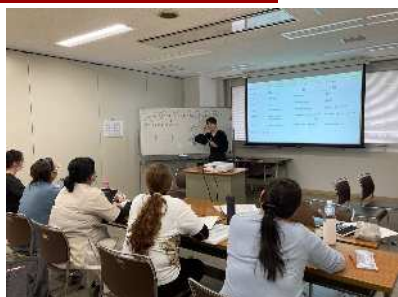
Aprendizado do conteúdo teórico