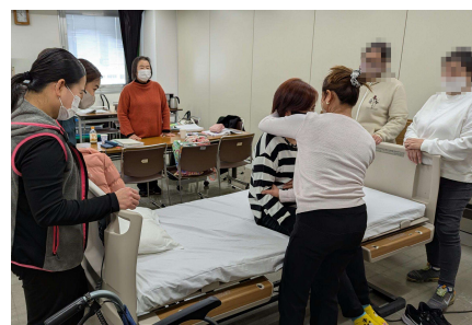
Magsanay ng kakayahan