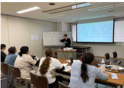
Matuto ng kaalaman