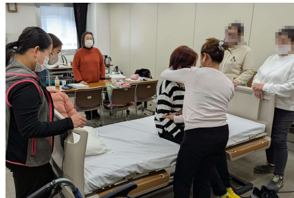
Domínio das técnicas de cuidados