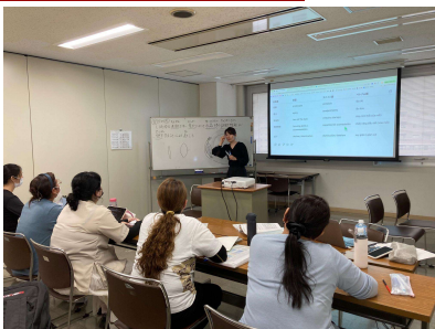
Aprendizado do conteúdo teórico