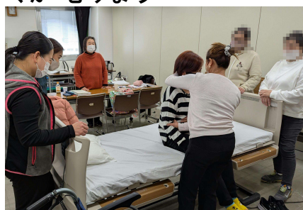
ぎじゅつを みに つけます